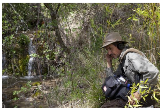
Prise de son par l'artiste dans sa « zone de silence », printemps 2012.

> Les samedis 02, 09 et 30 juin, et 07, 21 et 28 juillet de 15h à 17h.